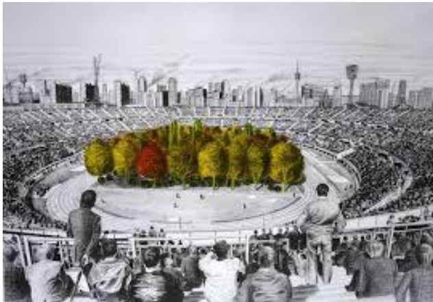
Max Peintner. The Unending Attraction of Nature, 1970/71

La arquitectura se vuelve una disciplina clave para la ciudad siempre y cuando fomente la participación ciudadana de manera amplia, abierta y tendiendo a la integralidad. La pregunta es ¿qué pueden impulsar o generar las prácticas arquitectónicas en los colectivos que habitan la ciudad (humanos y no humanos) que se relacionan con ellas? Podemos asegurar que las prácticas de relaciones que se dan en las espacialidades urbanas y edilicias pueden cambiar o incidir en la trayectoria de los porvenires.