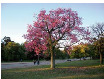
PALO BORRACHO (plaza)

Los ejemplares seleccionados para las terrazas son Espinillo (Acacia caven) y Barba de chivo (Cesalpinia gillesii). En la base de estos árboles bajos, o arbustivos, que harán las veces de bosque denso de baja altura, se utilizarán todo tipo de plantas herbáceas aromáticas que puedan ser utilizadas en la cocina de los retaurants: menta, orégano, tomillo, salvia, romero, estragón, ciboulet, etc