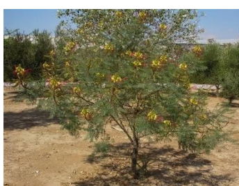
BARBA DE CHIVO (terrazza)